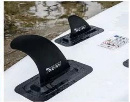
Three Slide Fins