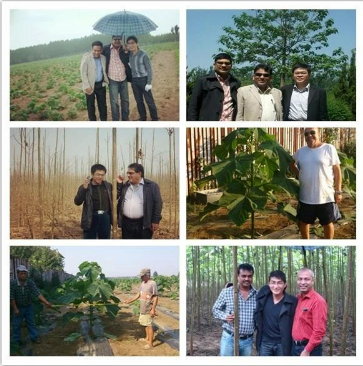
Müşterilerimizden gelen geri bildirim resimleri: