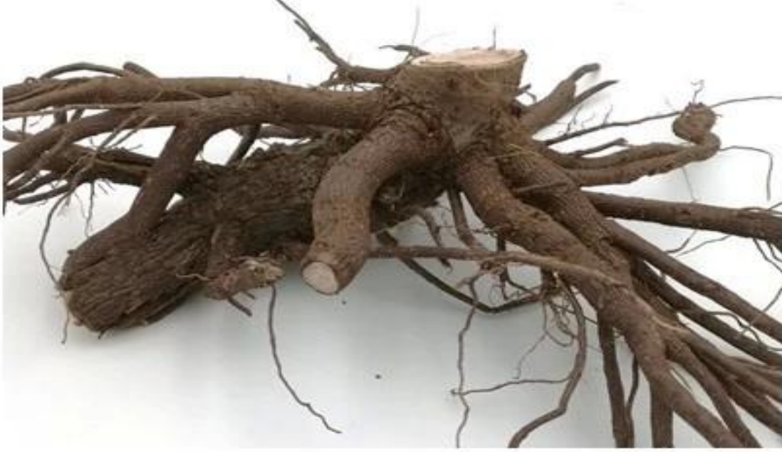
Dezenfeksiyon Paulownia kök