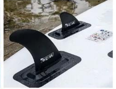
Three Slide Fins

Lütfen İletişim bize ğer Sahip olmak hiç soru Naber: 008618366003934 Wechat: 18366003934