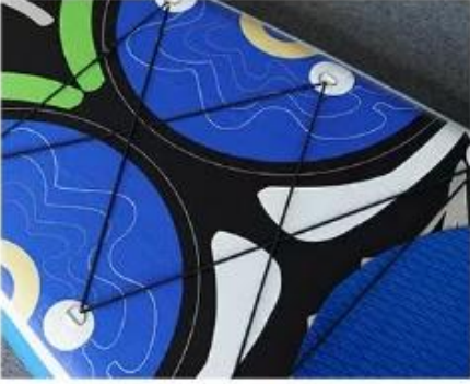
Bungee Rope Large Storage Space