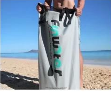
Easy To Store