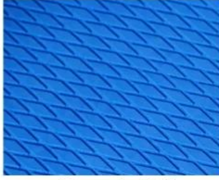
Non-slip EVA Friendly Surface