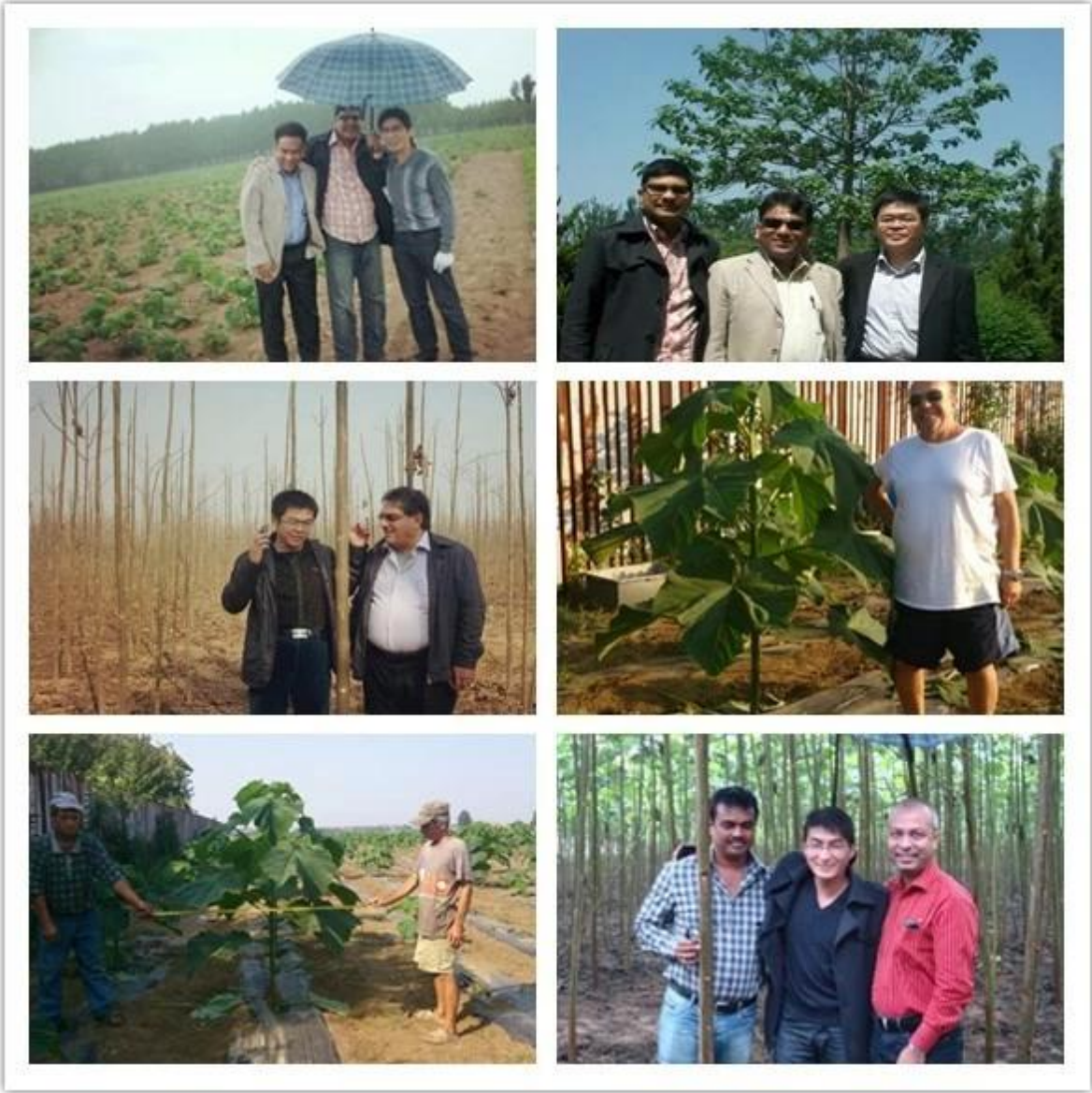
Imagens de feedback dos nossos clientes: