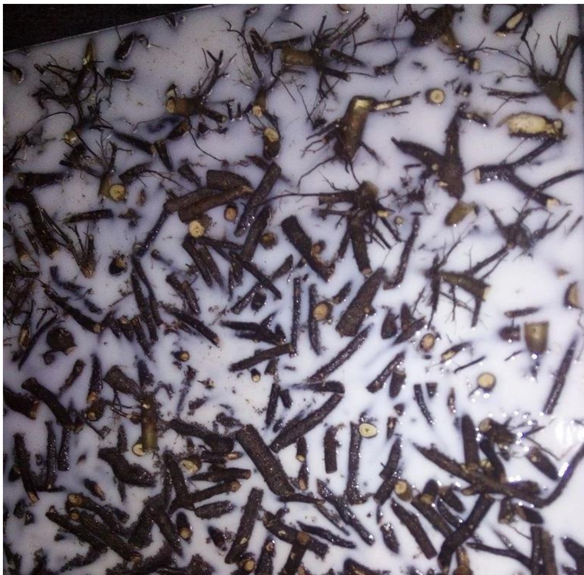
Embalando a raiz de Paulownia.