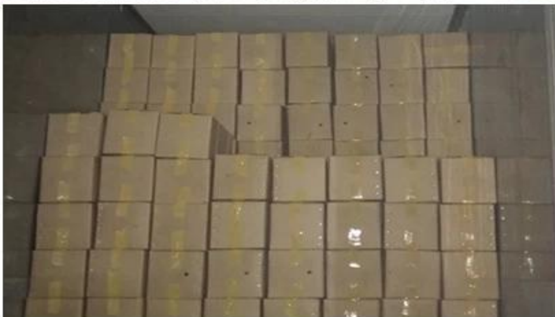
Pacote de toco Paulownia