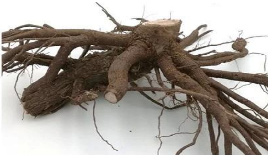
Raiz de paulownia de desinfecção