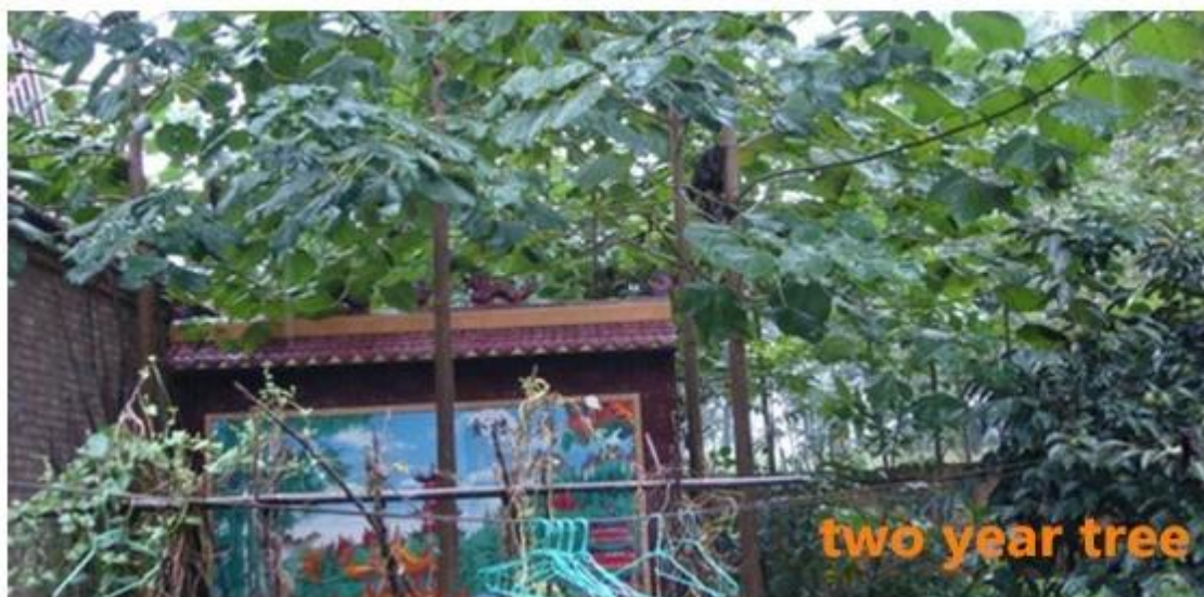
two year tree