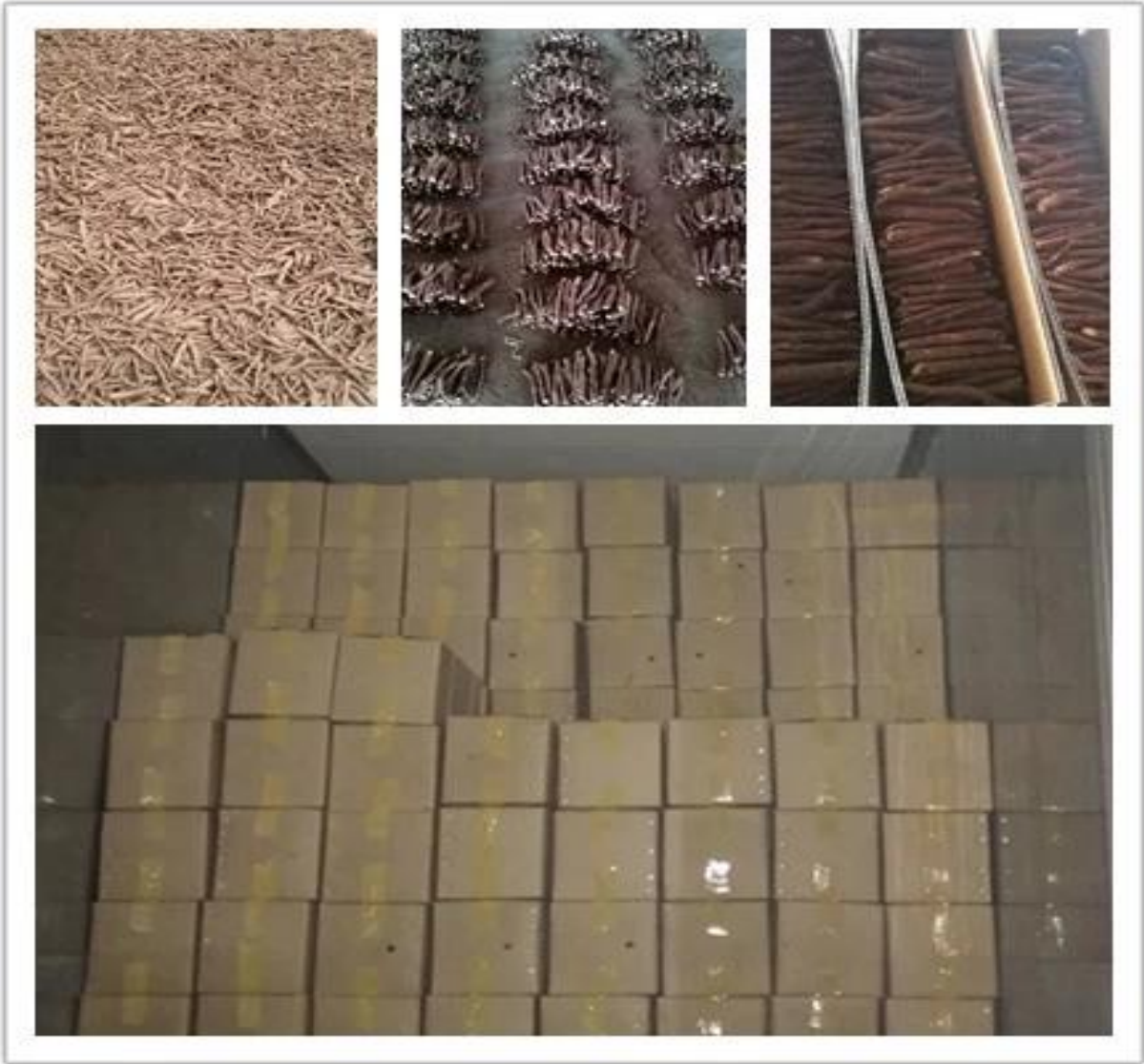
Paquet de souche de paulownia