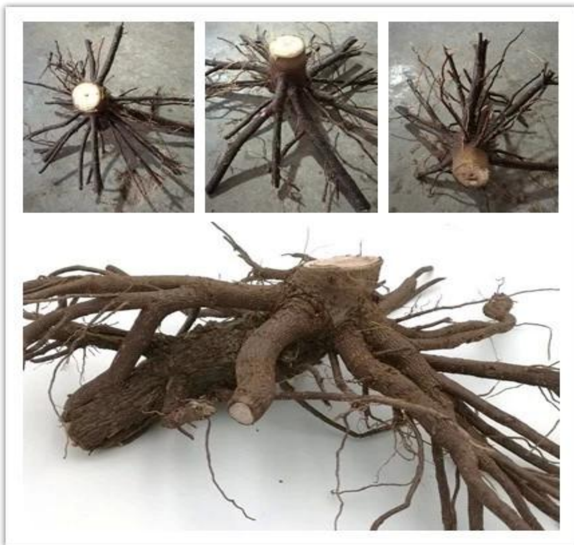
Désinfection de la racine de paulownia