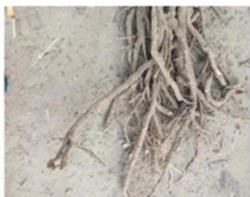
2. Cut paulownia tree root system