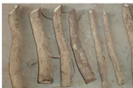
2-2. Cut root system to small pieces.