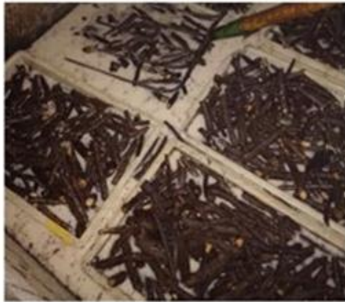
4.Desinfect paulownia root with chemical-cypermethrin