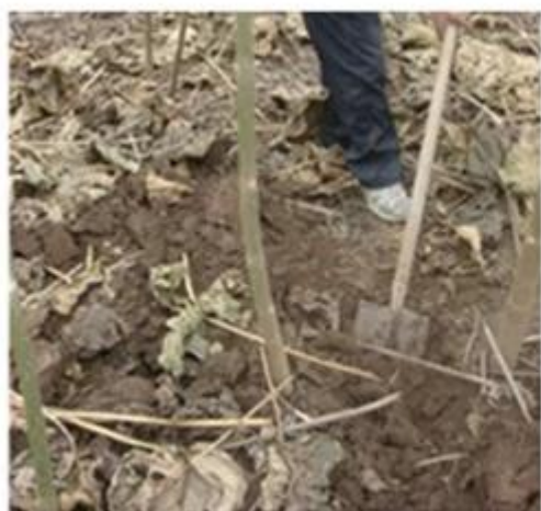
1. Dig out one year paulownia tree