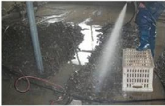
3.Clean paulownia roots with water.