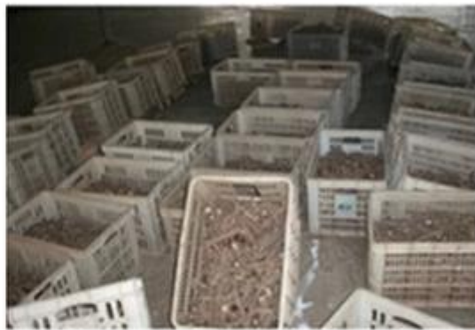
5-1. Dry them in plastic container