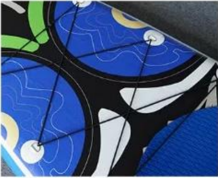
Bungee Rope Large Storage Space