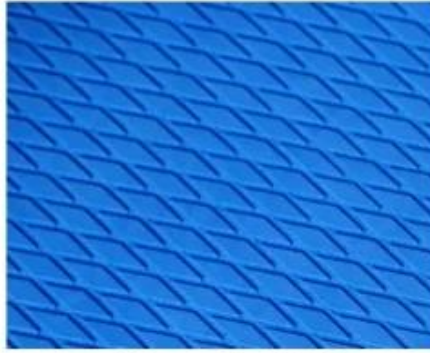
Non-slip EVA Friendly Surface