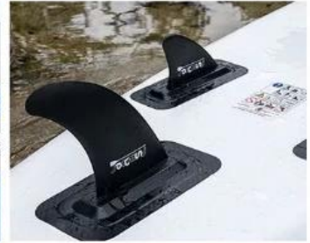
Three Slide Fins