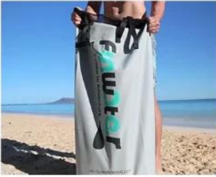
Easy To Store