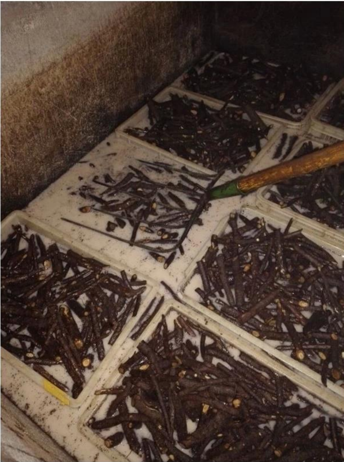
4.Desinfect paulownia root with chemical-cypermethrin