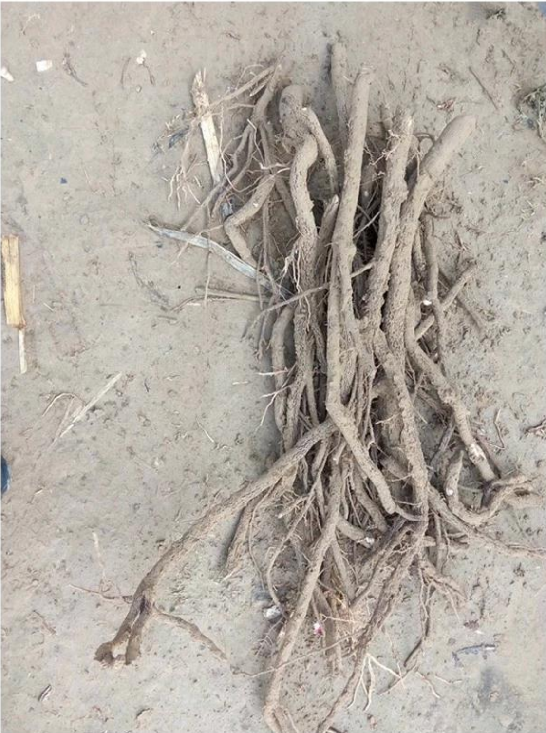
2. Cut paulownia tree root system