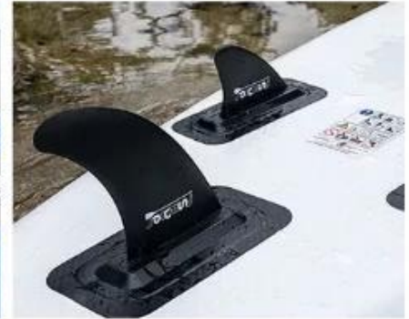
Three Slide Fins

Por favor contacta a nosotro si tienes ninguna pregunta WhatsApp: 008618366003934 WeChat: 18366003934