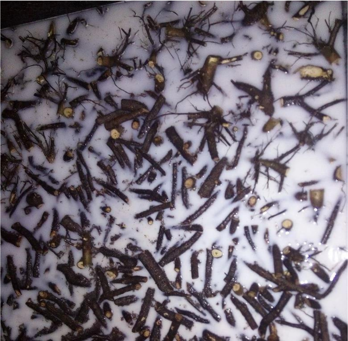
Packing Paulownia root