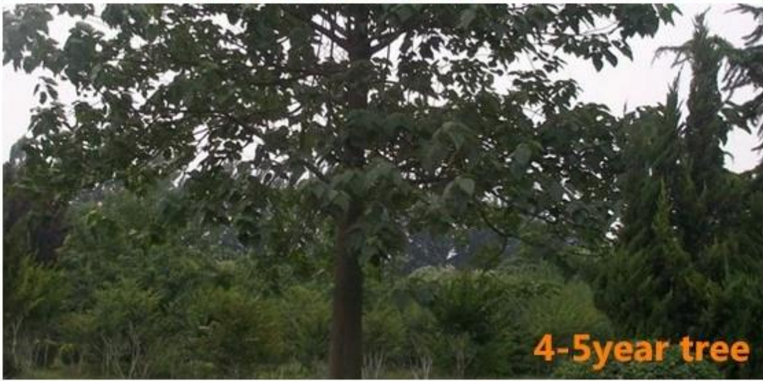
4-5 year tree