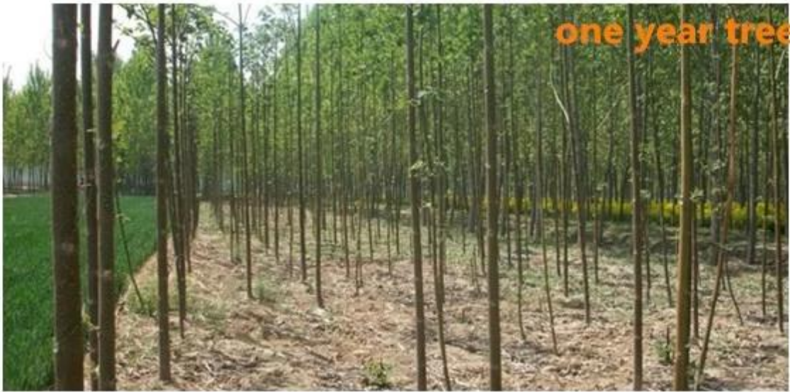
one year tree