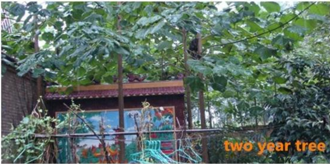
two year tree