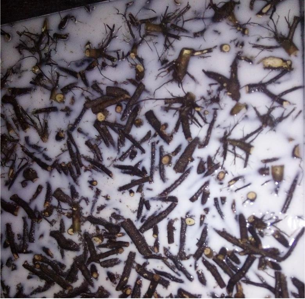
الجذر paulownia التعبئة