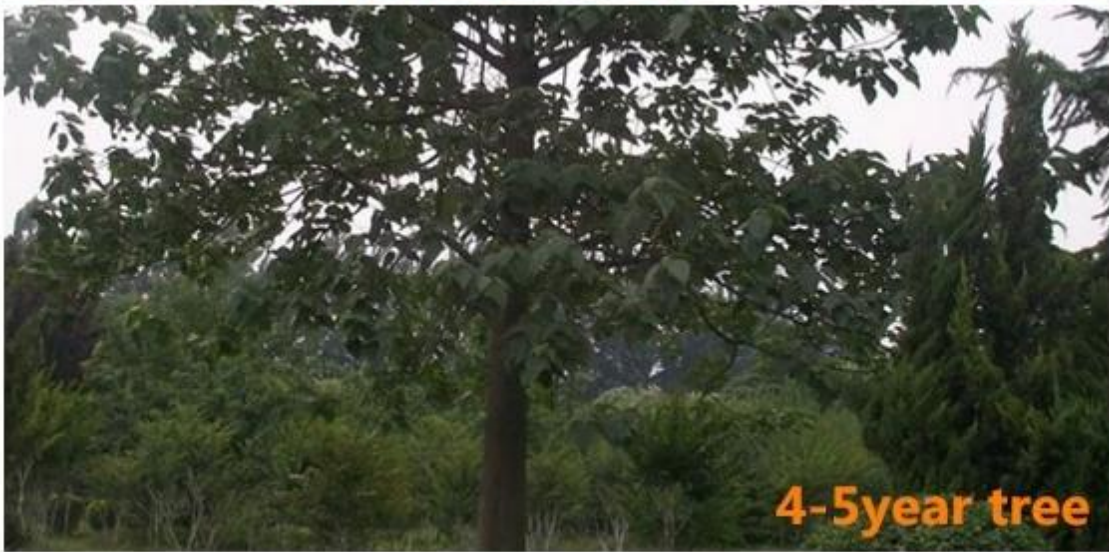
4-5 year tree